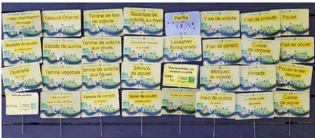
FIGURE 1 – Etiquettes produits de la ferme de Valensol.