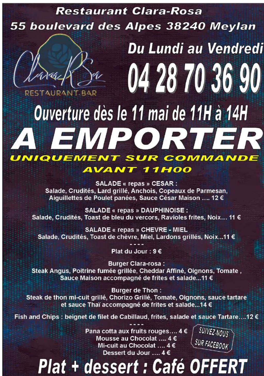
FIGURE 4 – Carte à emporter du Clara Rosa.